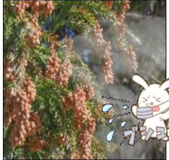
～参考～ 健康サイト byアリナミン製薬 https://alinamin-kenko.jp 2023年2月10日アクセス

ら吸いこんだ花粉が鼻に逆流し、鼻の奥に花粉が付着します。そうすることでアレルギー症状が起るといわれています。花粉症に限らず、コロナウイルスやインフルエンザウイルスも口を閉じて呼吸をすることで予防に繋がりますので意識してみましよう。