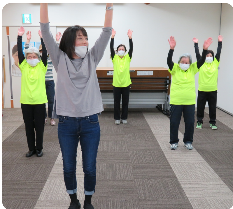
黒いアンダーシャツもおそろい・久米支部