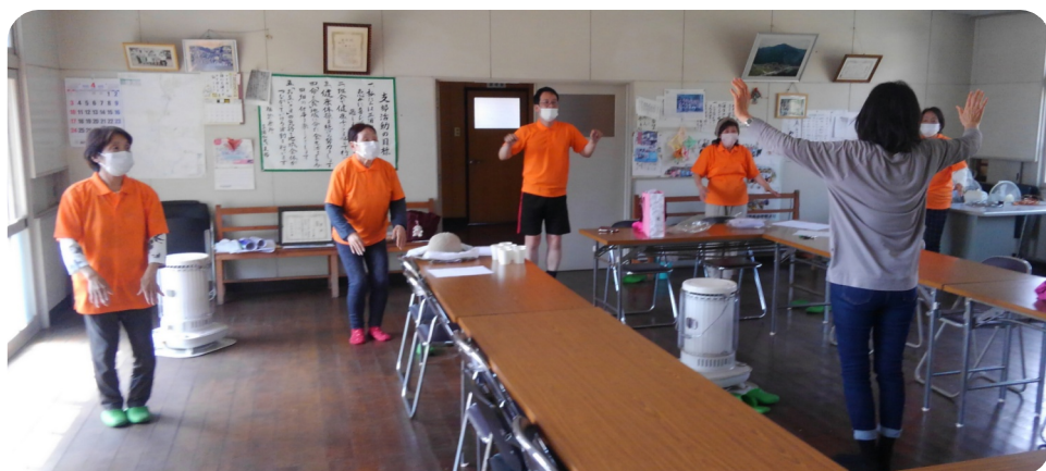
専務も一緒に体操・東部支部

津山医療生協のユーチューブチャンネルの初めての動画「津山医療生協きんちやい体操」。現在では他の動画とともにDVDも作成し、班会や集まりなど様々な場面で活用されています。 この「きんちやい体操」、体操はそのままに、組合員さんが津山の色々な場所に行って体操を行ったものを編集して新たなバージョンの「きんちやい体操」動画を作成中です。 写真はそれぞれの支部の直前練習の様子です。家で