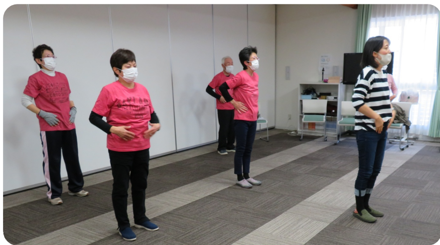
ピンクのTシャツがお似合い・佐良山支部